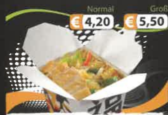
Normal € 4,20 Groß € 5,50 2C. Frischer Bratreis A,D mit gebackenem Hühnerfleisch im Teigmantel und Gemüse