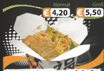
Normal € 4,20 Groß € 5,50 1C. Frische Bratnudeln D mit gebackenem Hühnerfleisch im Teigmantel & Gemüse