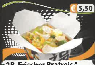
€ 5,50 2B. Frischer Bratreis A mit gebratenem Hühnerfleisch und Gemüse