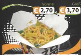
Normal € 2,70 Groß € 3,70 1A. Frische Bratnudeln D,M mit frischem Gemüse (vegetarisch)