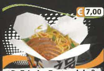
€ 7,00 1D. Frische Bratnudeln D mit gegrilltem Entenfleisch und Gemüse