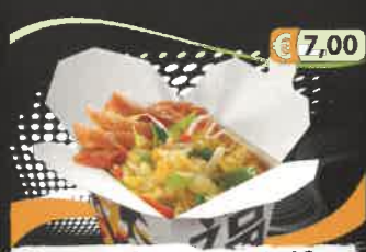
€ 7,00 2D. Frischer Bratreis A,D mit gegrilltem Entenfleisch und Gemüse