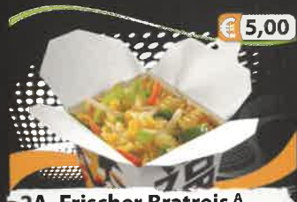
€ 5,00 2A. Frischer Bratreis A mit frischem Gemüse (vegetarisch)