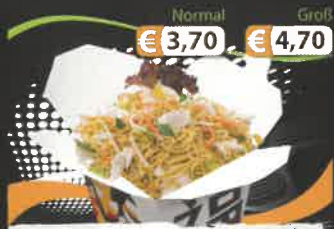
Normal € 3,70 Groß € 4,70 1B. Frische Bratnudeln D mit gebratenem Hühnerfleisch und Gemüse